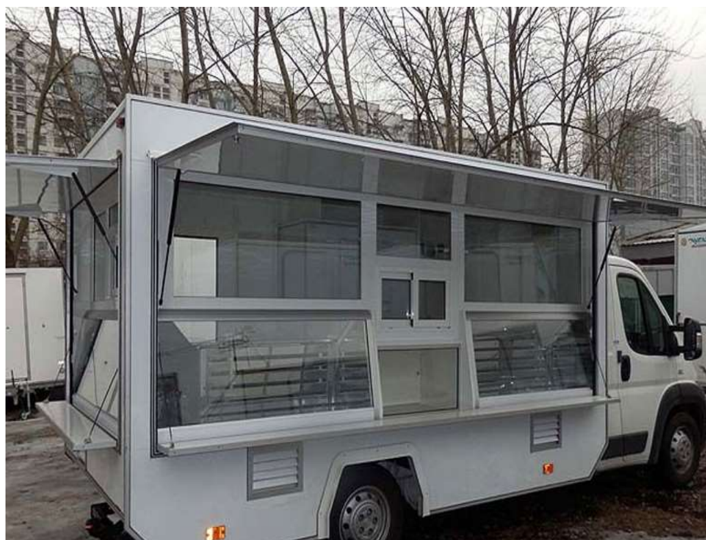
Сезонное (летнее) кафе