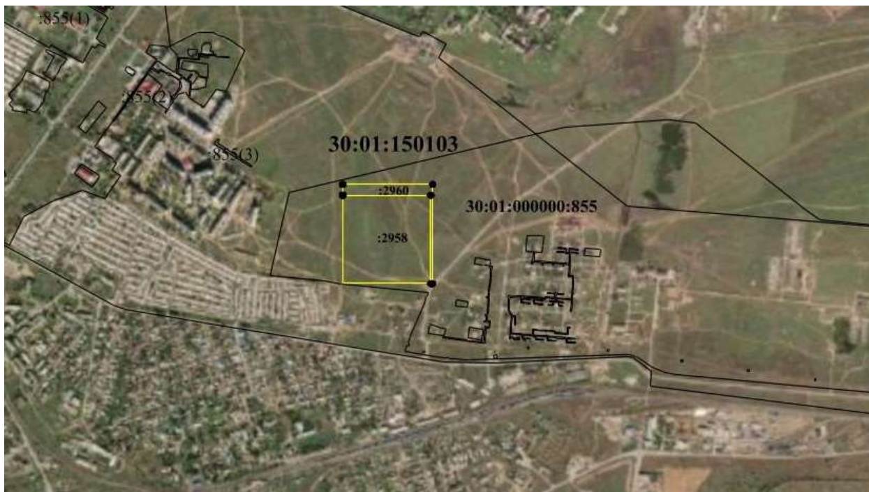
Схема границ территории комплексного развития: